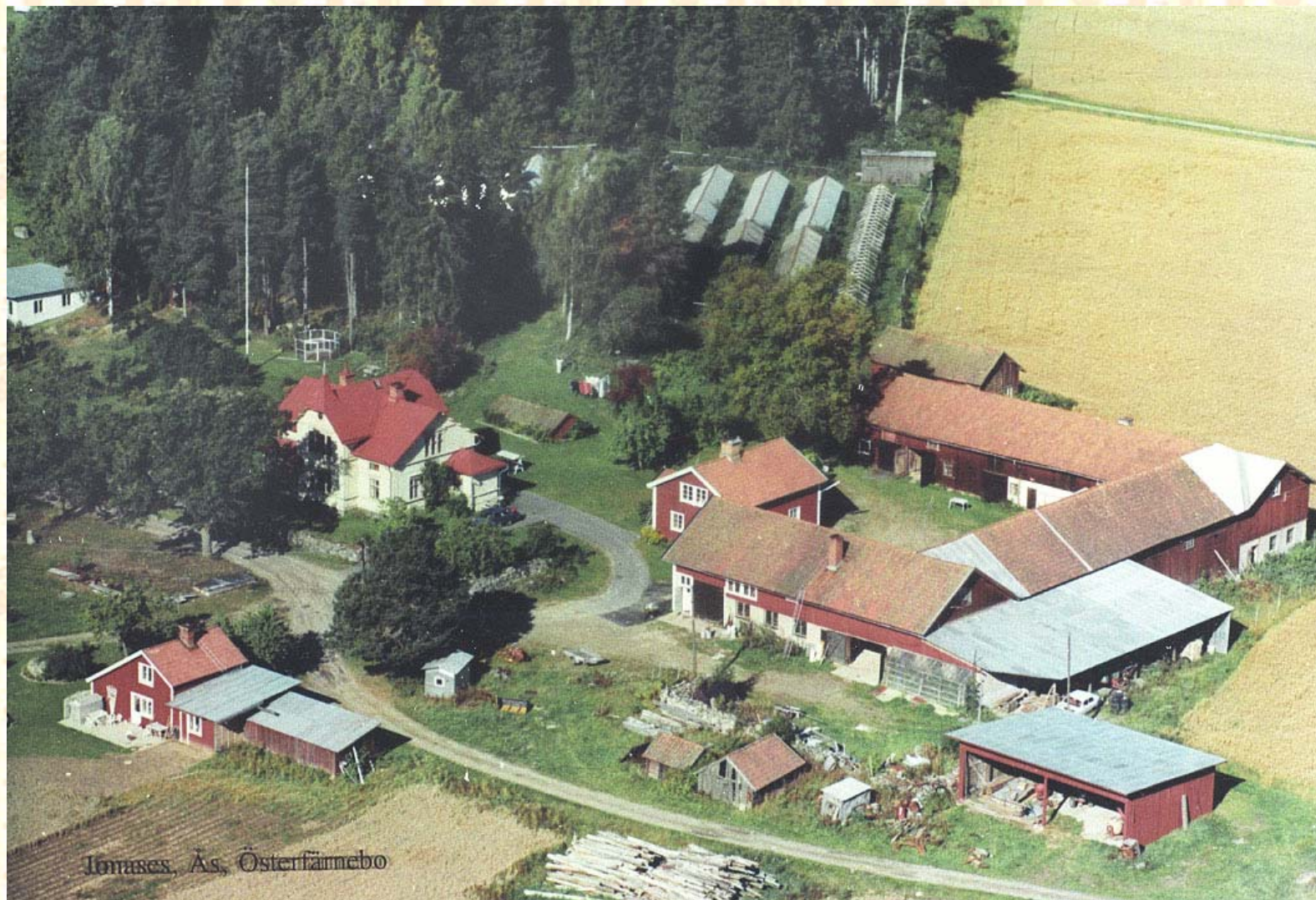
Jonases, Äs, Österfärnebo